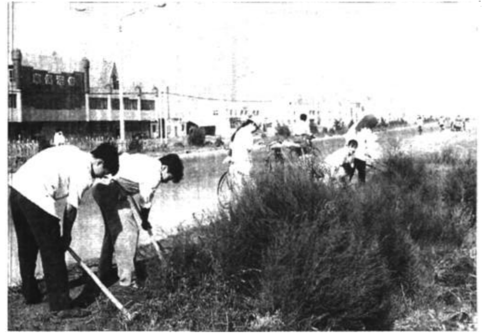
垦利公路局经常组织干部职工走上街头参加义务劳动,以树立良好的社会风尚。

垦利公路局定期组织干部职工开展技术比武活动,激发干部职工钻研业务的积极性。