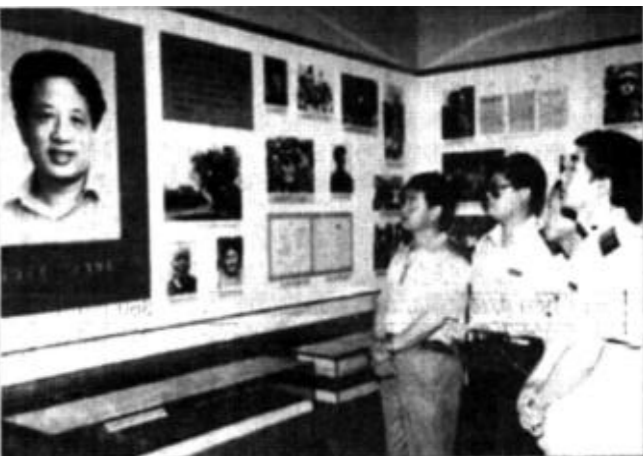
近日，市国税局组织广大党员干部参观了孔繁森纪念馆。