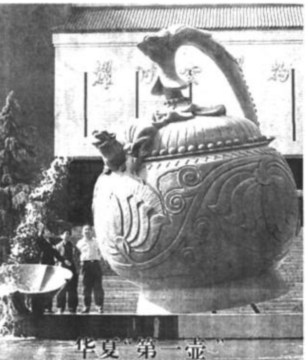
陕西省铜川市耀州窑博物馆门前广场上的宋代倒装瓷壶是目前全国最大的“壶”。壶高5.8米，直径3.9米，壶腹空，可引水入内，由壶嘴流出，注入壶内仿古青釉碗内。

是制造业投资快速增长，促进了传统产业的优化升级。二是基础设施建设步伐进一步加快，其中邮电通信业完成投资435亿元，增长46.7%；社会服务业完成投资520亿元，增长41.0%。三是科教投资力度加大，文教卫生广播福利业完成投资285亿元，增长31.6%；科研综合技术服务业完成投资31亿元，增长69.6%。